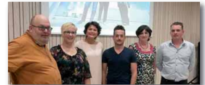
Sabien mee op de foto met het vernieuwd bestuur van Open Vld Houthulst. De komende jaren wil het bestuur vooral luisteren naar de Houthulstenaar, en er staan tegen de gemeenteraadsverkiezingen van 2018.