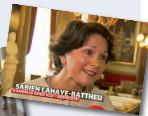
VTM Nieuws, 25 mei 2015