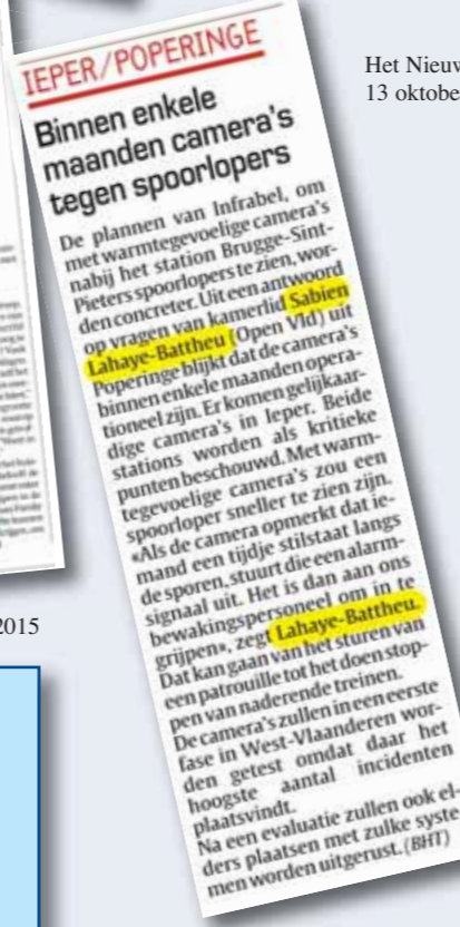
Het Nieuwsblad, 13 oktober 2015