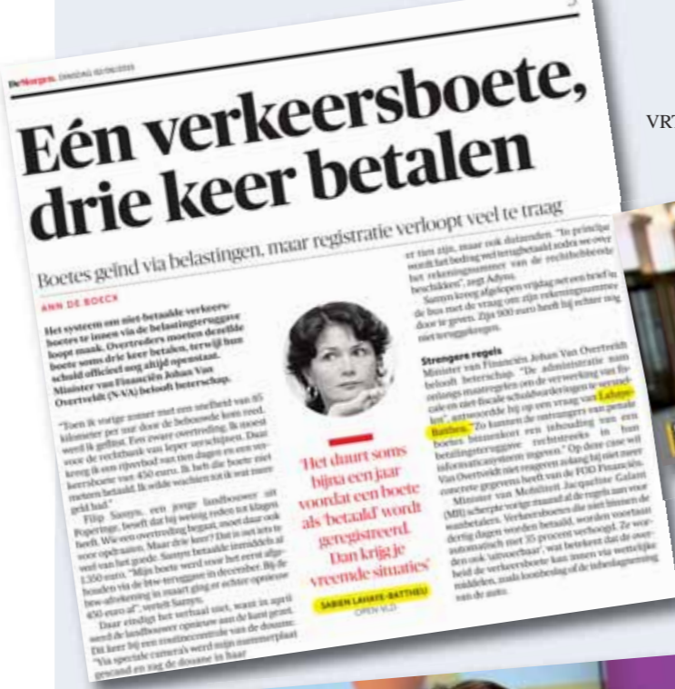
De Morgen, 2 juni 2015